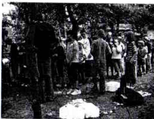
Die Schlange zur Bürgermeisterwahl

Was für einen Namen bekommt die Stadt? Der Name wurde gewählt. Der Name für die Stadt heisst: DIE SELBSTGebaute Stadt. (Nancy und Lisa)